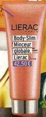
LIERAC Body-Slim Minceur globale, Lierac 42,50 €

Mincir, lisser les capitons, hydrater, sublimer... Ce nouveau soin est parfait pour celles qui veulent le beurre, l'argent du beurre... et les fesses de Gisele Bündchen!