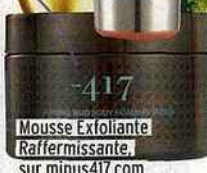
Mousse Exfoliante Raffermissante sur minus417.com 59 €

Ce gommage corporel à la boue de la mer Morte (connue pour ses vertus raffermissantes) est l'arme qu'il vous faut pour traquer la cellulite dès la douche.