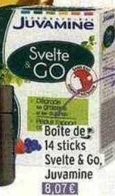
JUVAMINÉ Svelte & GO Boîte de 14 sticks Svelte & Go, Juvamine 8,07 €

Après un repas copieux, on limite les dégâts en gobant un stick magique. Celui-ci permet de réduire l'apport calorique et de piéger les graisses avant leur stockage!