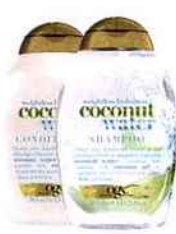
Shampooing et après-shampooing Coconut Water de OGX, 9,95 € chacun.