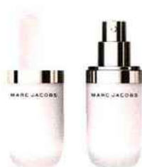
Base de teint lissante à la noix de coco Under(cover), Marc Jacobs Beauty, 39 € chez Sephora.

Non contente d'hydrater notre peau et nos crinières, la noix de coco est également la meilleure alternative à nos smoothies d'été : rafraîchissante, son eau régule la température du corps en cas de grosse chaleur, nous aide à lutter contre la déshydratation même sous 40 °C et renforce notre système immunitaire, pour une teneur en sucre cinq fois inférieure à la majorité des jus de fruits et 45 calories par verre en moyenne. Pour une cure détoxifiante, on verse deux cuillères de la nouvelle Water Detox de Biocyte, qui associe la noix de coco à l'aloë vera et au fenouil pour un effet reset de l'organisme, essentiel pendant et après les beaux jours.